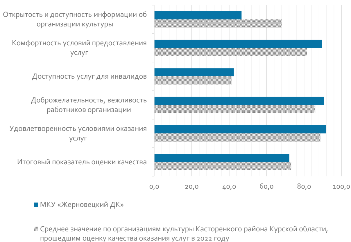
Рис. 1. Показатели оценки качества условий оказания услуг МКУ «Жерновецкий ДК» в 2022 году, баллы

Значения рассчитанных показателей оценки качества условий оказания услуг МКУ «Жерновецкий ДК» проиллюстрированы на рисунке 1.